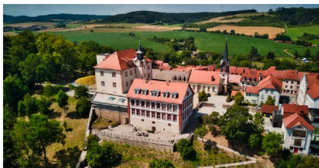
Abb. 1: Schloss Geisa

Ort: Schloss Geisa Schlossplatz 4 36419 Geisa Tel. 036966 7593550 Mail: info@schlossgeisa.de Am 09. Mai 2023 im Technologiezentrum DUO LAB